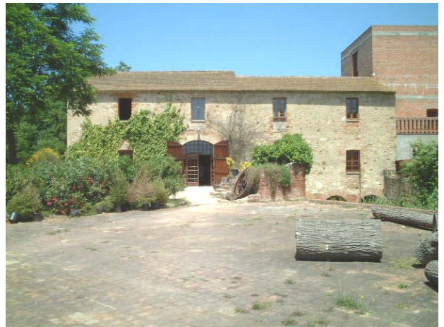
Centre Especial de Treball el Molí d'en Puigvert